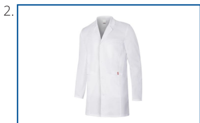
Tablier de laboratoire