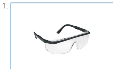
Lunettes de sécurité